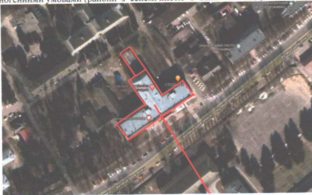
Місце розташування об'єкта

Земельна ділянка не відноситься до територій зі складними інженерно-геологічними та техногенними умовами (райони з сейсмічністю 6 балів та вище).